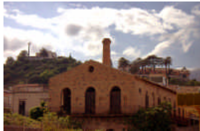
L'Antica Filanda di Roccalumera